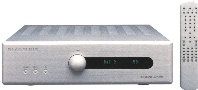
BLADELIUS S101 ¥577,500 (本体価格 ¥550,000)

そして今回、ブラデリウス自身が満を持して完成させたハイエンドのインテグレートド・アンプ。それがS101です。完全バランス増幅回路。1,800VAの大容量のトロイダル・パワートランスによる余裕の大出力。ドイツWBT社製のスピーカー端子をはじめ高音質パーツの数々。妥協を許さないブラデリウスのオーディオ哲学が随所に貫かれた結果、インテグレートド・アンプながらもセパレート・タイプに匹敵するか、もしくは凌駕するまでの音楽表現力に届きました。