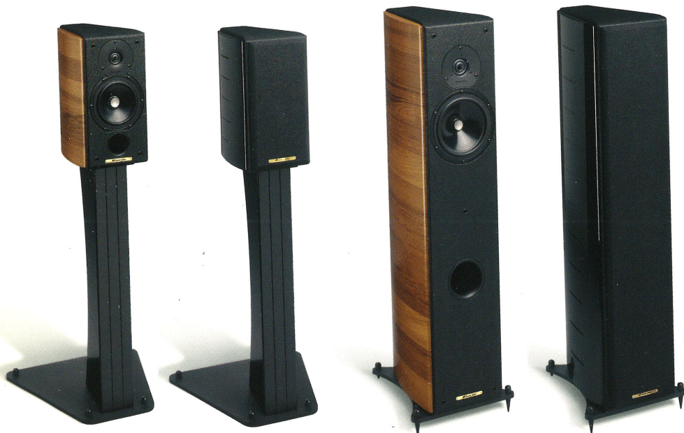
concertino domus 2-way 2-speaker system

●形式：フロア・スタンディング型、フロント・バスレフ型 ●使用ドライバー・ユニット（防磁型）：高域=25mm口径リング・ラジエーター、中低域=180mmペーパー・コーテッド・コーン使用フリー・コンプレッション・ドライバー ●クロスオーバー・周波数：3.6kHz（6dB/oct.） ●周波数特性：35Hz~20kHz ●音圧レベル：88dB SPL（2.83V/1m） ●インピーダンス：4Ω ●耐入力：30W~200W ●寸法・重量：205W×990H×310Dmm、23.2kg ●価格：Teak ¥225,000/本、Black ¥210,000/本