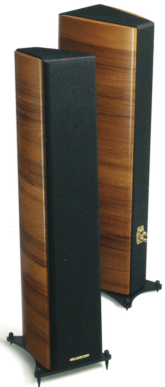
grand piano domus 3-way 4-speaker system

“domus”とは“家”を意味するラテン語。インテリアにじっくりなじむデザイン、住む人のハートに溶け込む柔らかな音をお届けしたいという、ソナス・ファベールの願いが込められています。すなわち、“Home”から一歩前進し、リビング環境との調和をより積極的に考えたシリーズとすることができます。