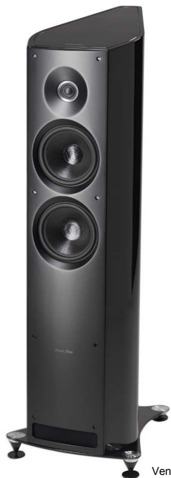
Venere 2.5 BK