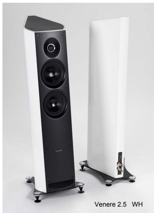
Venere 2.5 WH

希望小売価格 357,000円(税込・ペア) 本体価格 340,000円(税抜) カラー:ピアノ・ブラック(BK)/ピアノ・ホワイト(WH)