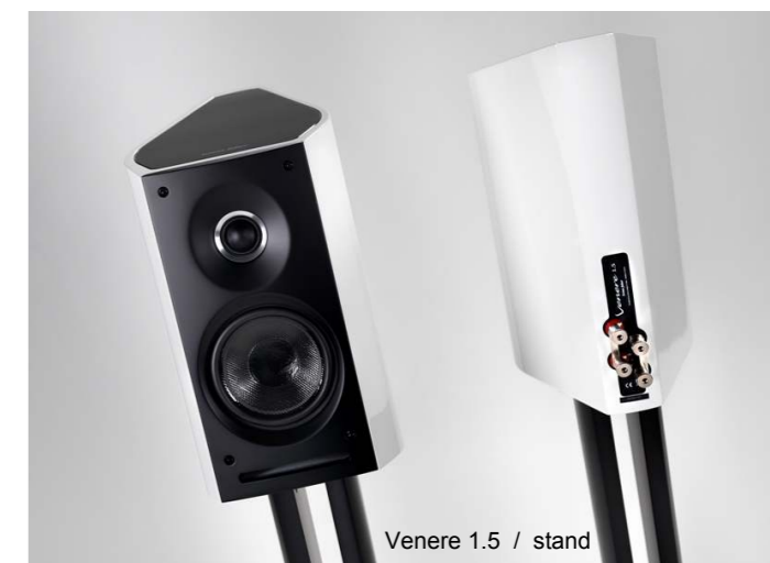
Venere 1.5 / stand

希望小売価格 157,500円(税込・ペア) 本体価格 150,000円(税抜) カラー:ピアノ・ブラック(BK)/ピアノ・ホワイト(WH)