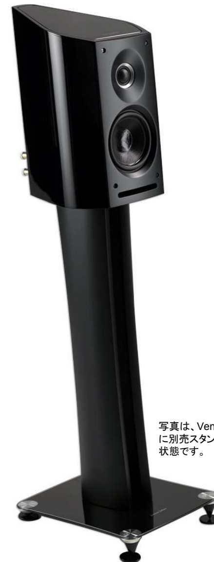
写真は、Venere 1.5 BKに別売スタンドを装着した状態です。