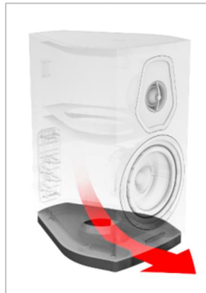
ブックシェルフ型