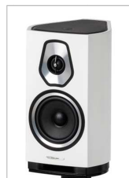
Matte White (マット・ホワイト)