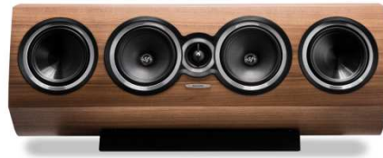
SONETTO CENTER II