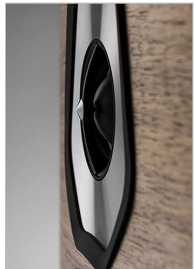
アローポイント・DAD ツイーター