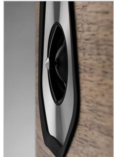
アローポイント・DAD ツイーター