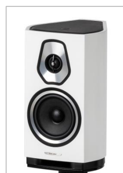
Matte White (マット・ホワイト)