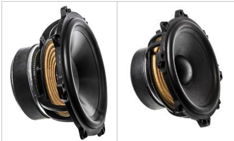
ミッドレンジユニット