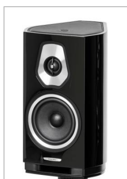
Piano Black (ピアノ・ブラック)