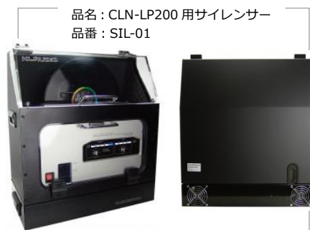
品名：CLN-LP200 用サイレンサー 品番：SIL-01