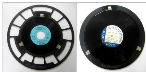
品番：ADT-LP07 品番：ADT-LP10 (別売) 7 インチレコード、10 インチレコード用アダプター