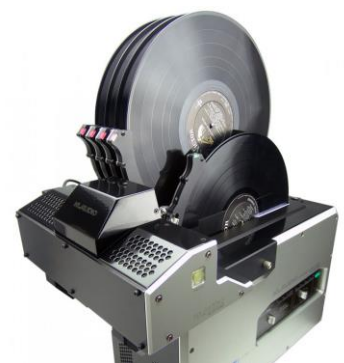
CLN-LP200 用 オート・ディスク・ローダー ATL-RCM05 装着例

KLAUDI o 超音波式レコードクリーナー「CLN-LP200」の最新鋭な洗浄性能を体験してください。レコード盤面に癒着した「粉じんや汚れ」「カビ」「洗浄液（薬品）」などは、レコード盤のみならず使用する大切なカートリッジの寿命をも縮めてしまう大敵です。新品レコードでも「剥離剤」でコーティングされています。