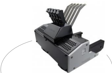
品名：CLN-LP200 用 オート・ディスク・ローダー 品番：ATL-RCM05